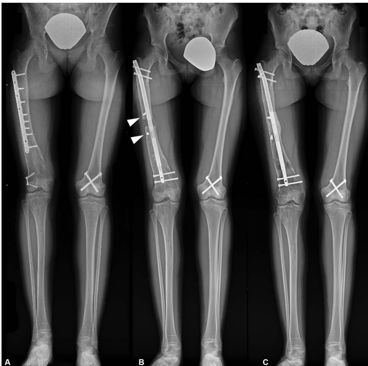
Fig. 2 Alargamiento de Fémur en Encondromatosis. (A): Discrepancia de longitud de Fémures. La placa se colocó después de sufrir una fractura. (B): Durante el alargamiento. Las puntas de flecha muestran los tornillos de bloqueo. (C): Resultado final.

baja tasa de fallas. 9 Eso ha llevado a una tendencia cada vez mayor al uso de esos sistemas en desmedro de los fijadores externos. Aunque esos últimos tendrían la ventaja de permitir la corrección de deformidades en forma simultánea al alargamiento, existen varios trabajos que han demostrado la eficacia del uso de esos implantes para fijar correcciones agudas y luego realizar alargamiento progresivo. 10-14 En esta serie, 3 pacientes (5 segmentos) presentaban deformidades concomitantes, que fueron corregidas durante la cirugía. La clave del éxito en esos casos, es el uso de tornillos de bloqueo ( Poller screws ). La planificación pre operatoria es fundamental en esos casos. 15